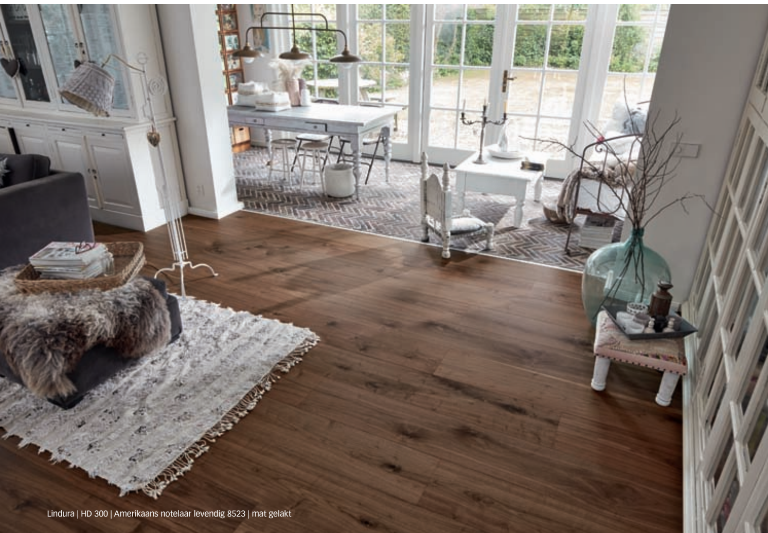
Lindura | HD 300 | Amerikaans notelaar levendig 8523 | mat gelakt