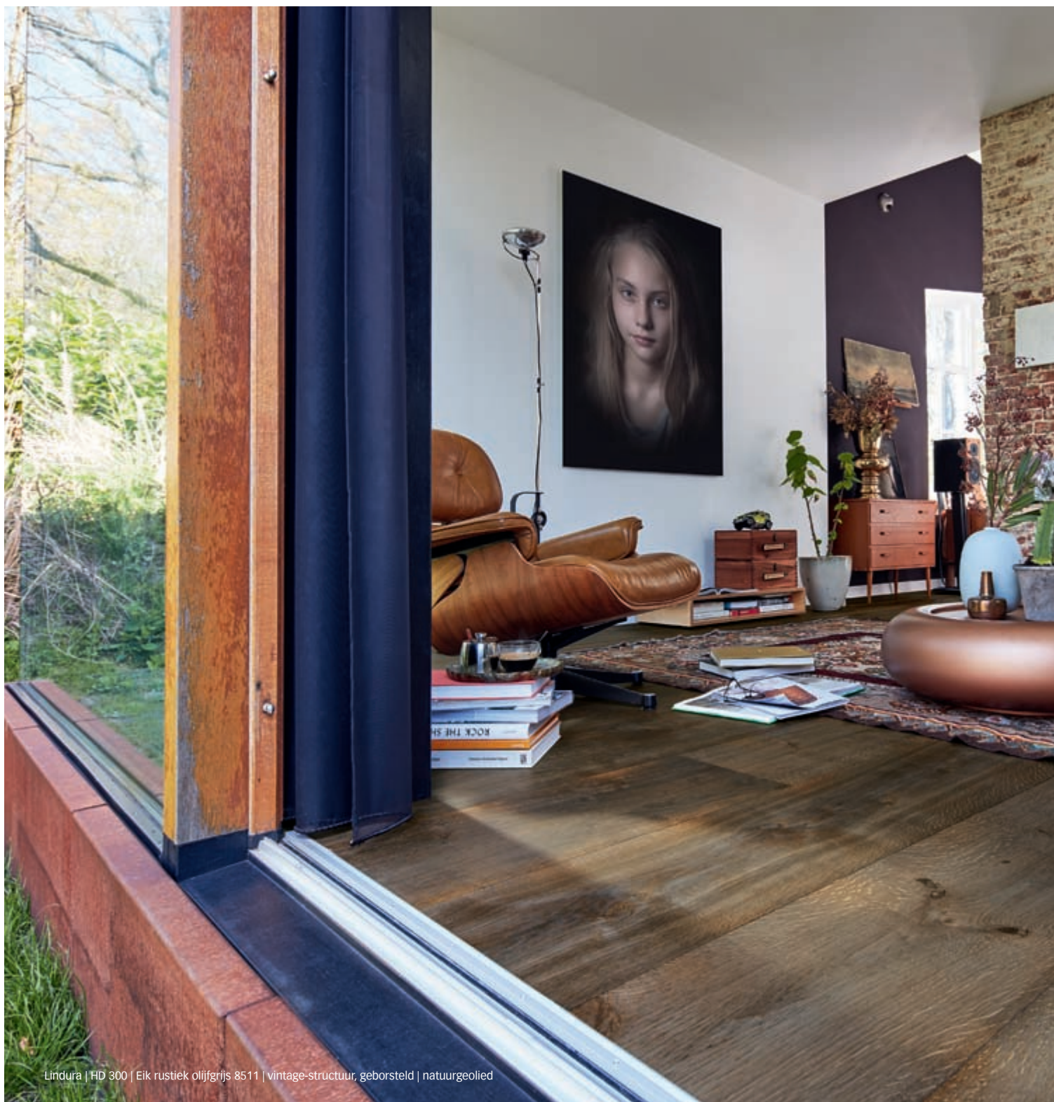
Lindura | HD 300 | Eik rustiek olijfgrijs 8511 | vintage-structuur, geborsteld | natuurgeolied